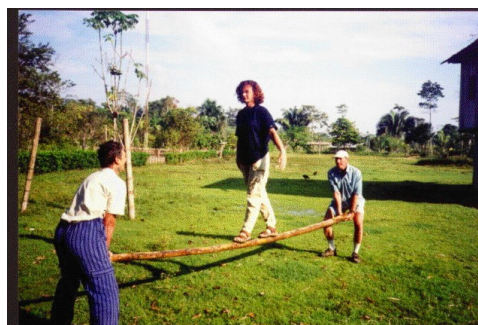
Barre Russe en Amazonie