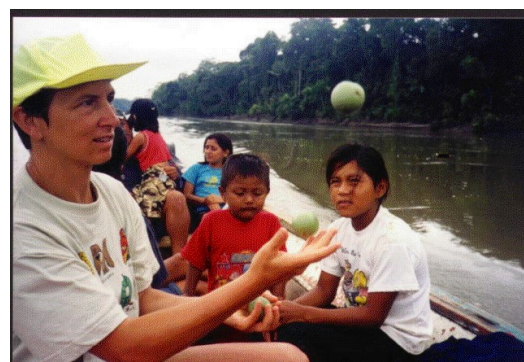
Jonglage sur pirogue